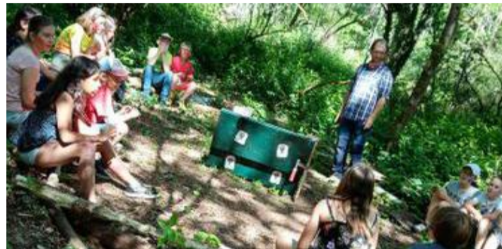
L'école du dehors, de plus en plus pratiquée par les instituteurs

Le CRIE, Centre régional d'initiation à l'environnement, qui est initié à l'école du dehors depuis de nombreuses années a créé des outils à destination des instituteurs. Un concept qui connaît un grand succès même au-delà des frontières belges.