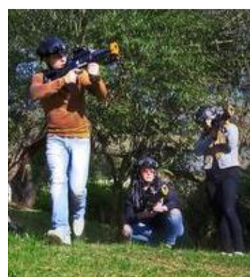
Inscrits prioritaires

Il s'organisera dans la partie ancienne du parc de Mouscron, où 240 jeunes pourront participer à cette « battle royale » inédite. Deux groupes