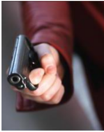
Il avait tiré en l'air